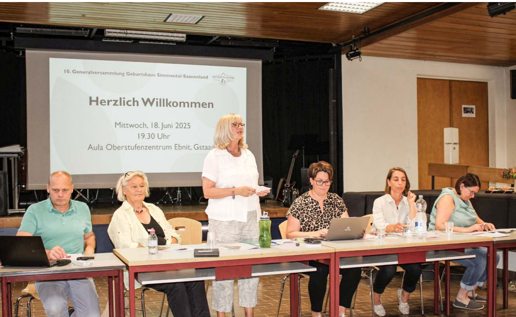
Co-Betriebsleitung und Teil der Verwaltung an der Jubiläums-GV im Juni 2025 in Gstaad

Stand 31.12.2025: 331 Genossenschafts-Mitglieder, mit 396 Anteilscheinen