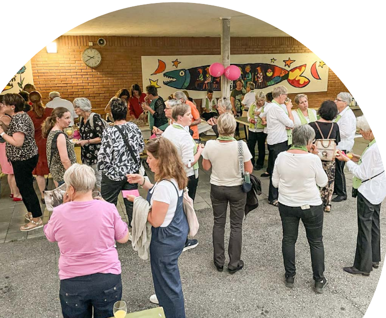
Gemütliche Stimmung beim Apéro nach der Jubiläumsfeier.

www.maternitealpine.ch/ unterstuetzung/foerderverein